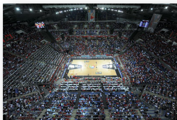
Sinan Erdem Dome / Istanbul

Les deux 1/2 finales, le match 3e place et la finale / Billets Cat 2